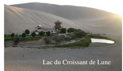
Lac du Croissant de Lune

Départ tôt le matin en train (train de jour non climatisé place assise) ou en car pour Dunhuang, carrefour très important de la Route de la Soie. Visite du Lac du Croissant de Lune, au pied d'immenses dunes, dont la plus haute s'élève à 1 715m, s'étend un miraculeux plan d'eau, une vue somptueuse sur le désert ondulant et les peupliers verts en contrebas. Découverte du mont Mingsha, "la Dune du Sable Chantant", qui doit son nom aux sons que produit le sable quand on glisse du sommet. Contemplation du coucher de soleil sur les dunes du désert. Nuit à Dunhuang