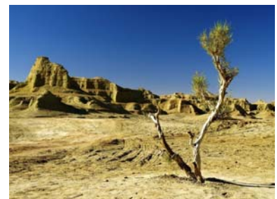
Désert de Gobi - Ruines

Randonnée dans le désert de Gobi. Pique-nique à midi. Départ en train de nuit couchette molle vers Turfan. Nuit à bord de train.