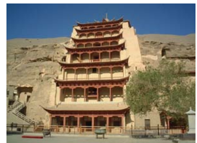
Grottes de Mogao

Visite des Grottes de Mogao. Les Grottes de Mogao recèlent des trésors d'art bouddhique parmi les plus remarquables du monde, l'un des fleurons des arts architectural, pictural et sculptural de la dynastie des Tang jusqu'à la dynastie des Yuan. Il y avait 1 000 grottes et niches, dont 492 existent encore aujourd'hui, dans lesquelles sont conservées 2 415 statues peintes, et 45 000m 2 de fresques. Pique-nique à midi. Tout l'après-midi, randonnée dans le désert de Gobi. Nuit à Dunhuang